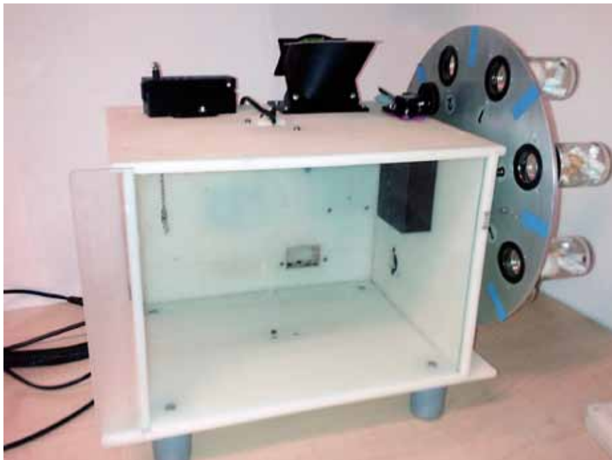
Afbeelding 1. De ART, de operant chamber waarin de ratten worden getraind voor het opspo- ren van geuren.

in september 2015 in gebruik werd genomen. De operant chamber (afb. 1) werd 'de ART' genoemd: de Automatic Rat Trainer. Het doel van de operant chamber is dat de ratten leren om verschillende geuren te discrimineren en een melding te geven bij een positief geurmonster. Voordat de ART klaar was, werden de ratten getraind in een houten model van de ART. Hierdoor werd de overstap naar automatische training in de ART zo soepel mogelijk gemaakt voor de ratten. Sinds het begin van de training in de ART hebben verschillende ontwikkelingen plaatsgevonden. De ratten moesten wennen aan het apparaat en wij moesten leren dat innovatie nooit zonder onverwachte tegenslagen gaat. Inmiddels heeft de operant chamber verschillende technische ontwikkelingen doorgemaakt en hebben wij nieuwe inzichten over de impact die geluid kan hebben op ratten.