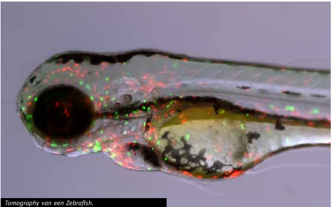
Tomography van een Zebrafish.

De zebravis is een veelbelovend model, maar er is nog veel onderzoek nodig om de kennis over dit dier verder uit te bouwen. In het toxiciteitsonderzoek is er mogelijk een belangrijke rol weggelegd voor snelle screenings van grote hoeveelheden kandidaatproducten. Maar de vervanging van zoogdieren door de zebravis in toxiciteitsstudies zal waarschijnlijk een zo lang validatietraject vergen dat de meesten van ons dat niet meer zullen meemaken.